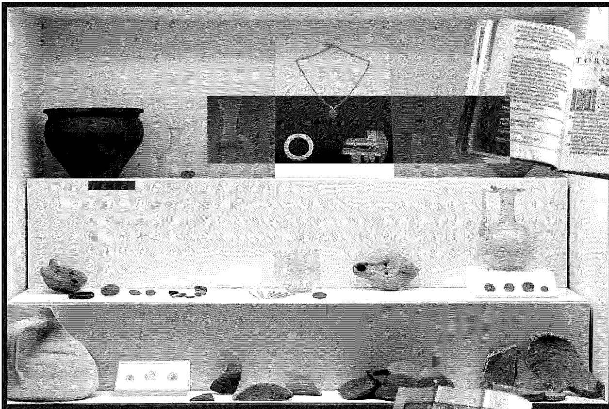
Il patrimonio Oggi aprirà la sala delle Cinquecentine con i suoi duemila volumi del XVI secolo, raccolti grazie a lasciti e donazioni (foto sopra e a sinistra). Nella ghiacciaia dell'ex monastero (a sinistra) sono esposti reperti antichi