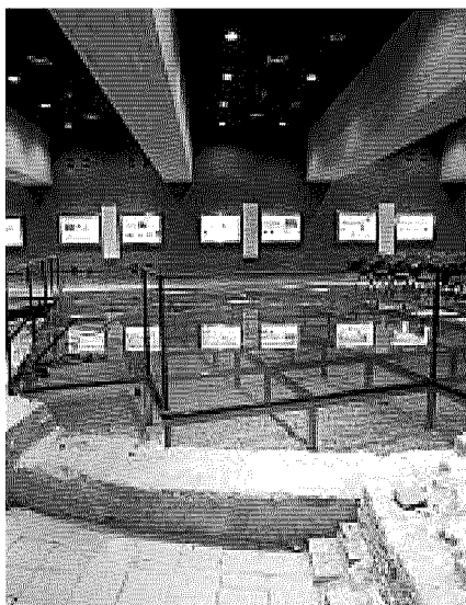
Archeologia L'aula Bontadini è sotterranea

L'università è museo per un giorno Visite nella ghiacciaia «segreta» e riscoperta di duemila libri antichi